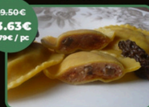
RAVIOLE FAISAN ET MORILLES

PRODUCTEUR DE RAVIOLES PREMIUM CONGELÉES