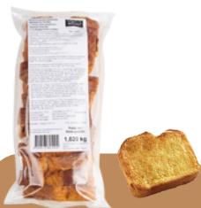
Brioche perdue tranchée Référence : .T0094