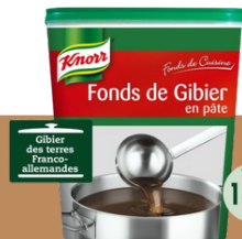
Fond de Gibier en Pâte Référence : .45409