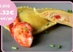
RAVIOLE HOMARD ET PETITS LÉGUMES