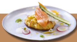
Gaufre de pomme de terre - 48 pièces *85 g Référence : .GFPDT