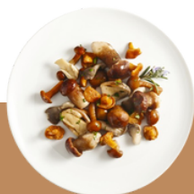
Champignon des bois entier mini Référence : .T0145