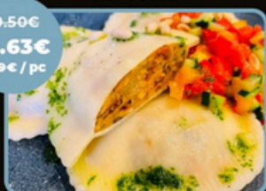
RAVIOLE LÉGUMES DU SOLEIL