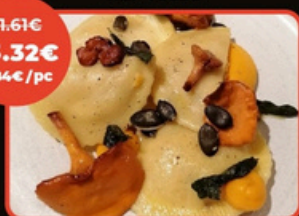
RAVIOLE RIS DE VEAU FAÇON « FORESTIÈRE »