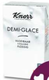
Knorr Professional Sauzen - Sauces Demi-Glace (1 L)