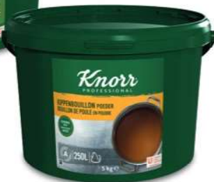
Knorr Professional Bouillons in Poeder - en Poudre Kippenbouillon - Bouillon de Poule (5 kg)