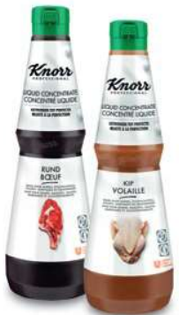
Knorr Professional Liquid Concentrate - Concentré Liquide Rund - Boeuf (1 L) Kip - Poulet (1 L)