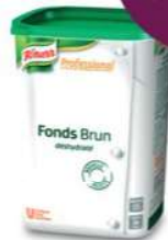
Knorr Professional Fonds Bruine Fond - Fonds Brun (0,9 kg)