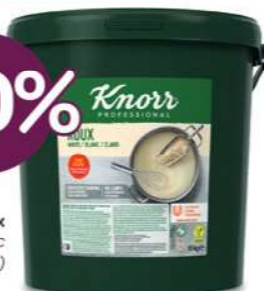
Knorr Roux Blanke - Blanc (10 kg)