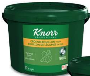
Knorr Professional Bouillons in Pasta - en Pâte Groentebouillon - Bouillon de Légumes (10 kg)