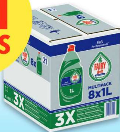
Dreft Regular 8x1 L 785522