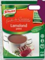
Knorr Fonds de Cuisine Lamstond - Fond d'Agneau (1 kg)