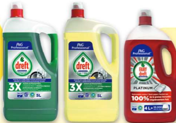
Dreft Original 2x5 L 988510