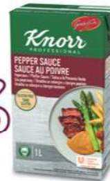
Knorr Professional Garde d'Or Sauzen - Sauces Peppersaus - Sauce au Poivre (1 L)