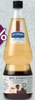
Hellmann's Vinaigrettes Balsamico - Balsamique (1 L)