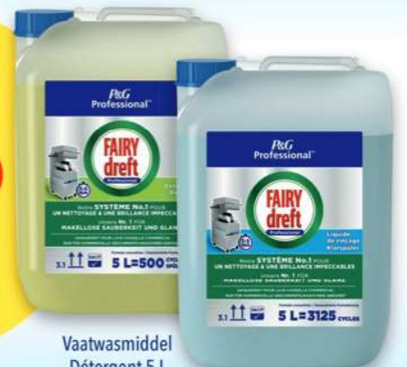
Vaatwasmiddel Détergent 5 L 159784