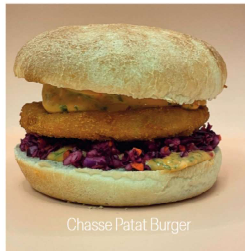
Chasse Patat Burger