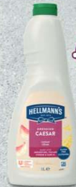
Hellmann's Dressing Caesar - César (1 L)