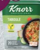
Knorr Professional Taboulé (625 g)