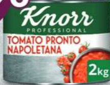
Knorr Professional Tomaten- producten - Produits de Tomates Tomatino (Zak - Poche, 3 kg) Napoletana (Blik - Boîte, 2 kg)