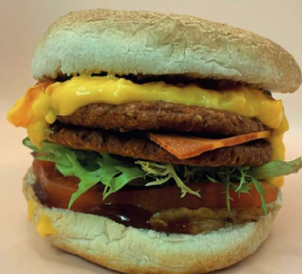
22 Bacon Cheeseburger

Les questions de principe sont moins importantes que l'humour, comme le prouve le jeune entrepreneur. Le menu affiche un « no-pig-dog ». Un en-cas avec un petit clin d'œil, car il s'agit d'un hot-dog végan à base de salade de chou, de jalapeños, de moutarde et d'oignons frits. Bref, un délice XL qui est proposé à 10 euros.