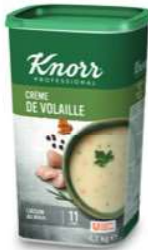
Knorr Professional Soepen - Potages Kippencrèmesoep - Crème de Volaille (1,1 kg)