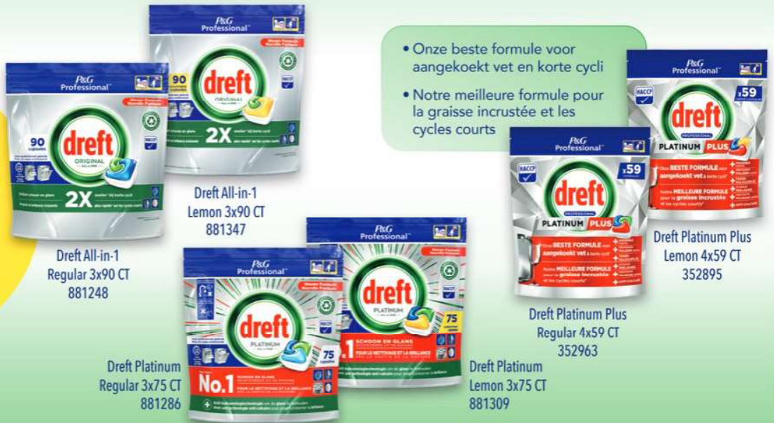
Dreft All-in-1 Regular 3x90 CT 881248